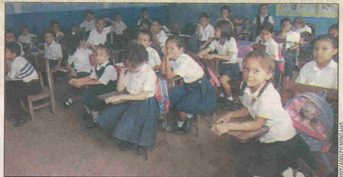
▶ Aquí estudian 80 niños y niñas desde preescolar hasta tercer grado.