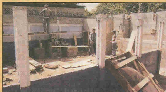
► La nueva escolita tendrá tres aulas, un comedor y una cocina.