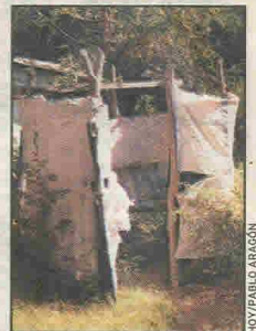
► Ésta es la letrina que usan los niños y niñas.

alumnos de la Escuela Cantar de Cantares del barrio Jorge Salazar estrenarán escolita dentro de 15 días.